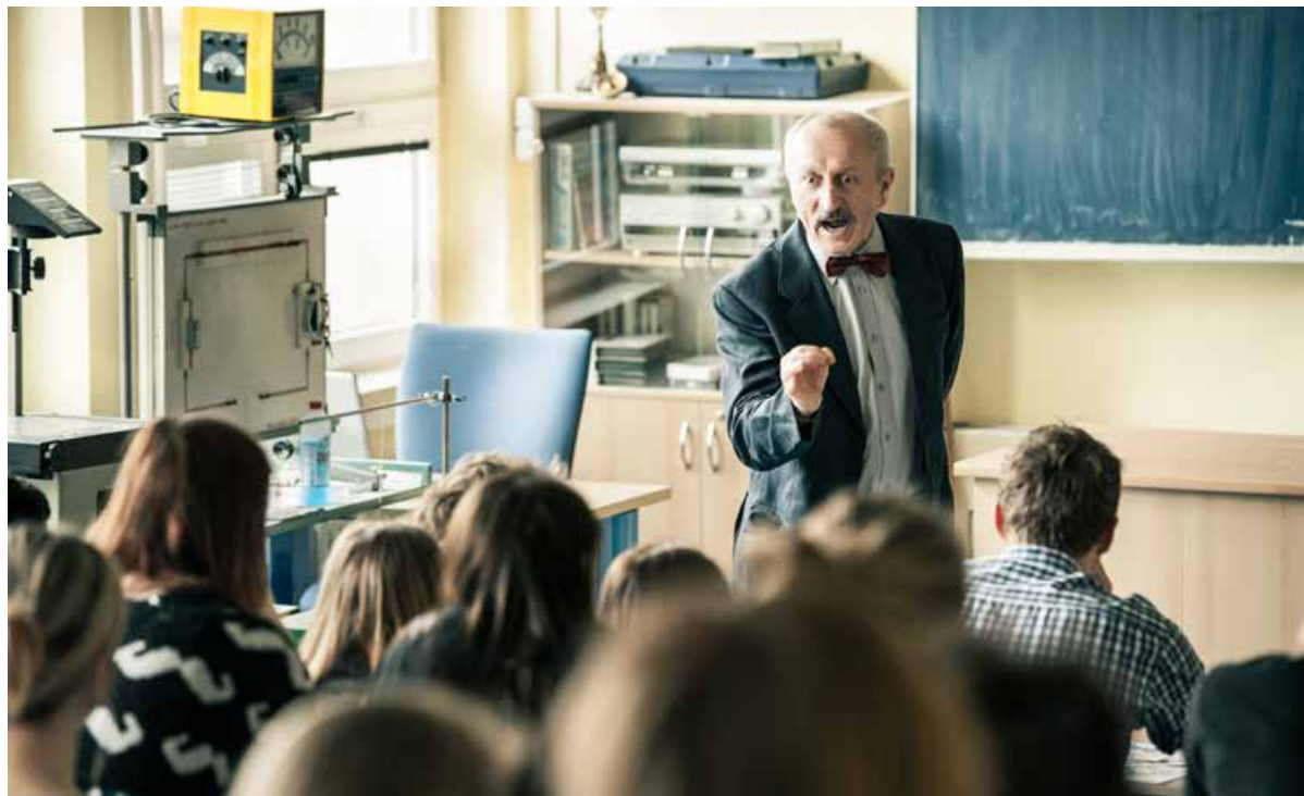
Divadlo Minor – Válka profesora Klamma.

Vstupenky si zájemci mohou zakoupit v pokladně Divadla loutek Ostrava, na webu www.dlo-ostrava.cz nebo v dalších prodejních místech – například v Ostravském informačním servisu. -gl-