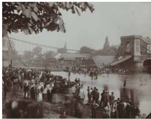
Pohled na zřícený řetězový most, 1886, Anton Brand.

Chcete-li se o této tragické události dozvědět něco víc, navštivte ve dnech 5. října až 27. listopadu v Ostravském muzeu výstavu, jež je tomuto tématu věnována.