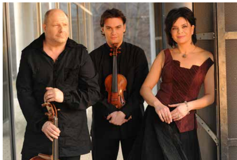
Úvodní z cyklu komorních koncertů Janáčkovy filharmonie obstará v pondělí 24. října od 19 hodin v Domě kultury města Ostravy Smetanovo trio.