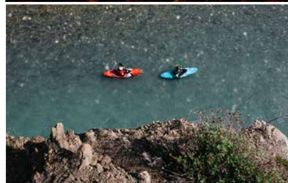
přírodních řek v Evropě. Pestrou festivalovou paletou doplňují krátké artové snímky Chaos Theory a Darklight.